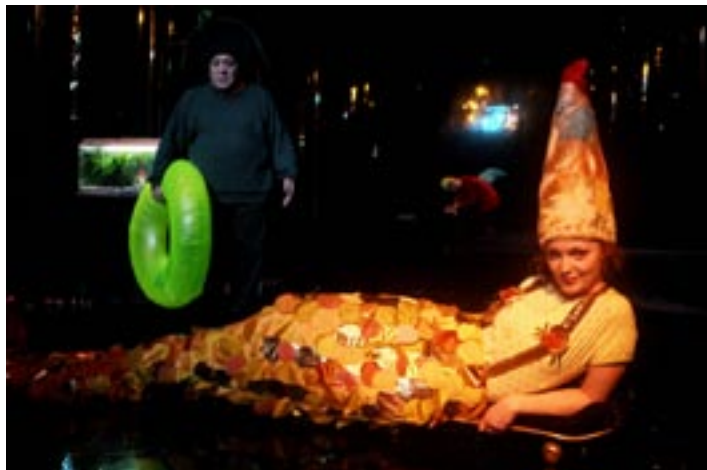
Från Tiokronorsflickan , Angereds Teater 2006

Var inte rädd för barnens känslor och reaktioner. Barn har en märkvärdig förmåga att hitta ljusglimtar i det som för oss vuxna ter sig hopplöst mörkt. Det som verkar skrämmande och sorgligt tangerar ofta barnens egna funderingar och kan på så sätt vara en igångsättare till samtal, samtal som kanske inte kommit till stånd annars. Våga möta barnens tankar när de dyker upp, vanligtvis efter föreställningens slut.